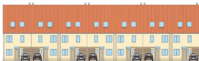
Hofseite – Eingänge